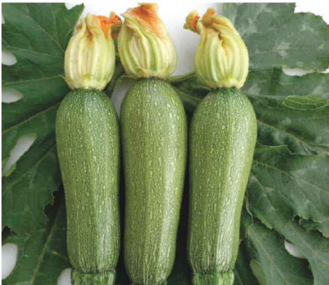
Grey Star F1